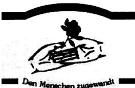
Seniorenzentrum St. Elisabeth Schapen